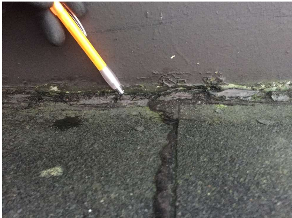
Visar anslutning mellan papp och plåt på ventilations huv som ej är intäkt. Pennan går att sticka in i sprickor som är en läckagerisk. Detta är Bild 3