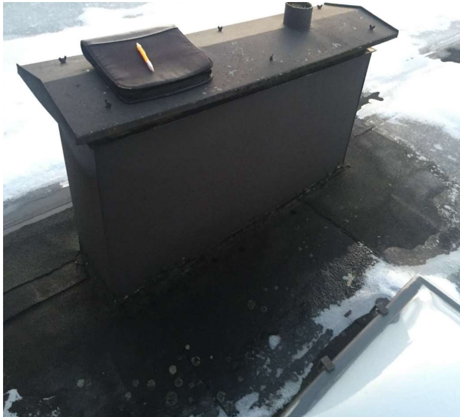
Bild visar ventilations huv som varje bostad har. Anslutning mellan papp och plåtbeslag till huvan är en läckagerisk då pappen ej är uppvikt, denna huv är ej intäkt. Detta är Bild 2.